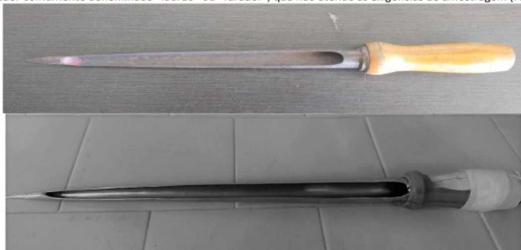
Figura 1 - Calador "ladrao" ou "furador".

7. Não é permitido o uso do calador comumente denominado "ladrao" ou "furador", que não atende às exigências de amostragem (Figura 1).